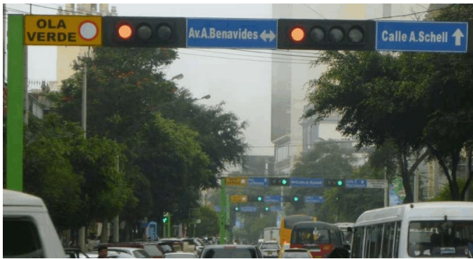
Ola Verde en la Av Larco, Miraflores - Lima.

Puede notar que la luz Verde avanza, transportando vehículos hasta el final de la Avenida